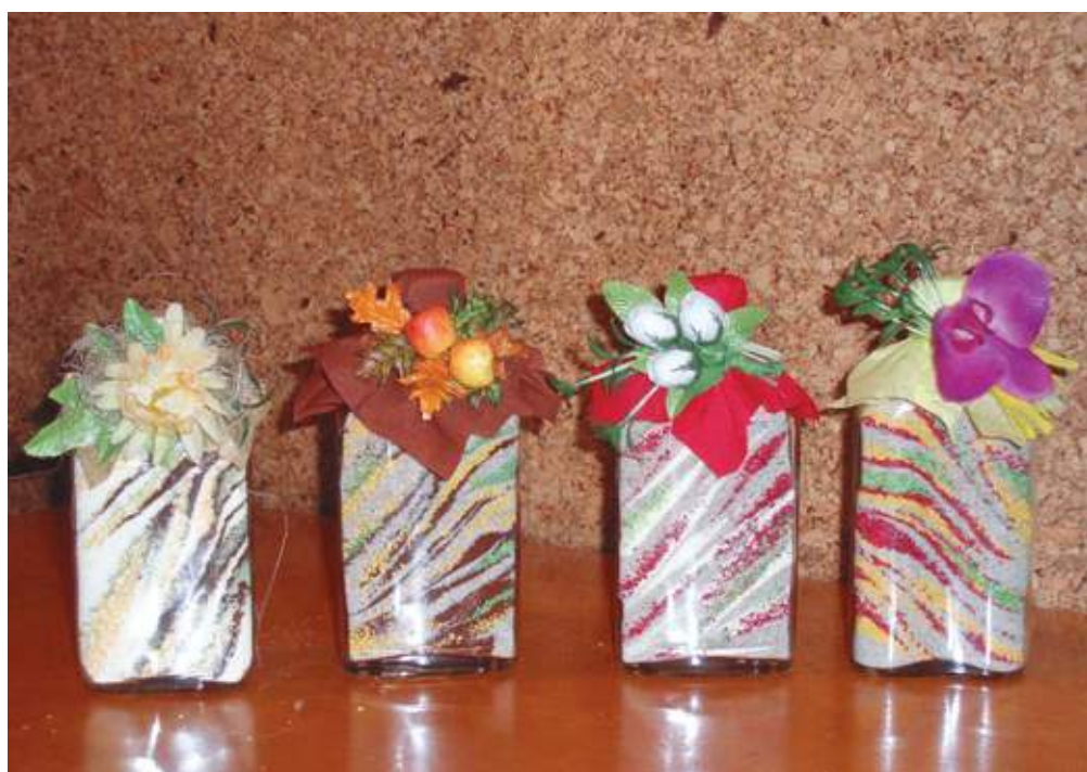
„Keturi metų laikai“