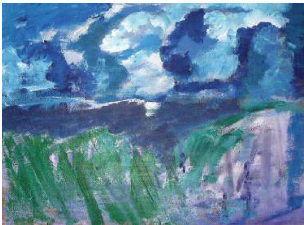
„Peizažas“, 2010 m., kartonas, akrilas