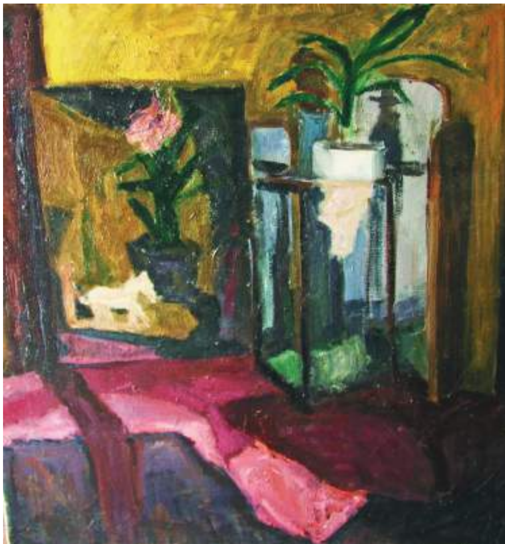
„Natiurmortas su veidrodžiu“

2000–2007 m. dirbo dailės mokytoju Neringos meno mokykloje. Nuo 2007 m. scenografas Neringos KTCL „Agila“.