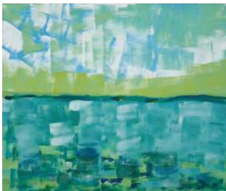
„Nubėgančios spalvos I“, 1200x1000, drobė, akrilas