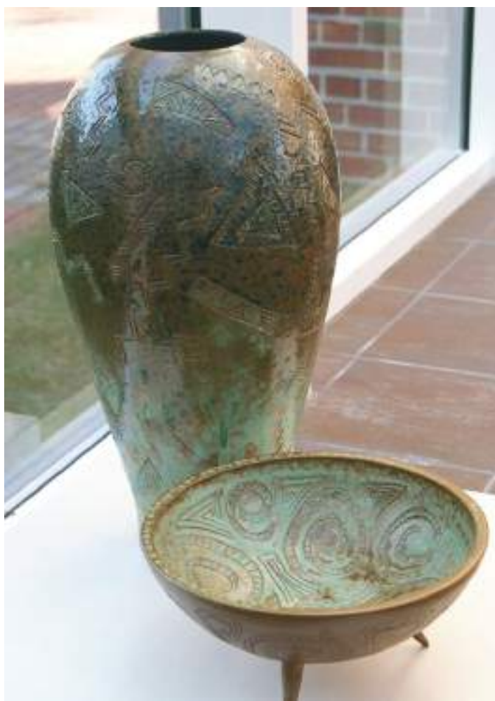
Diptikas „Smėlio fantazija“