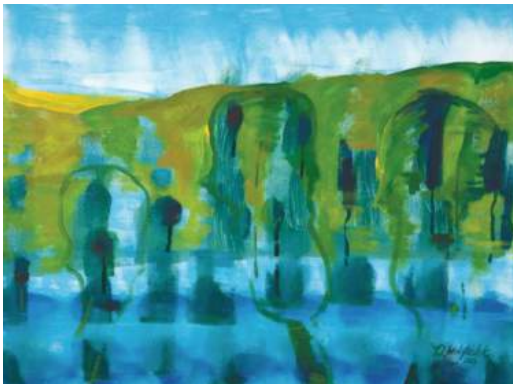
„Nubėgančios spalvos II“, 1200x1000, drobė, akrilas