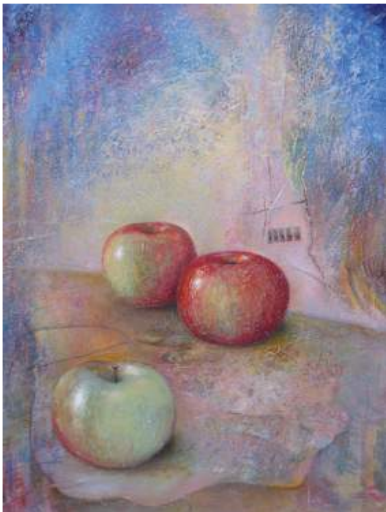
„Broliukai“, 80x65, drobė, aliejus

Nuo 2000 m. Evaldas Šemetulskis Neringoje rengia tarptautinius simpoziumus, kuriuose dalyvauja ir ekspozuoja savo darbus dailininkai iš Europos ir netgi Japonijos.