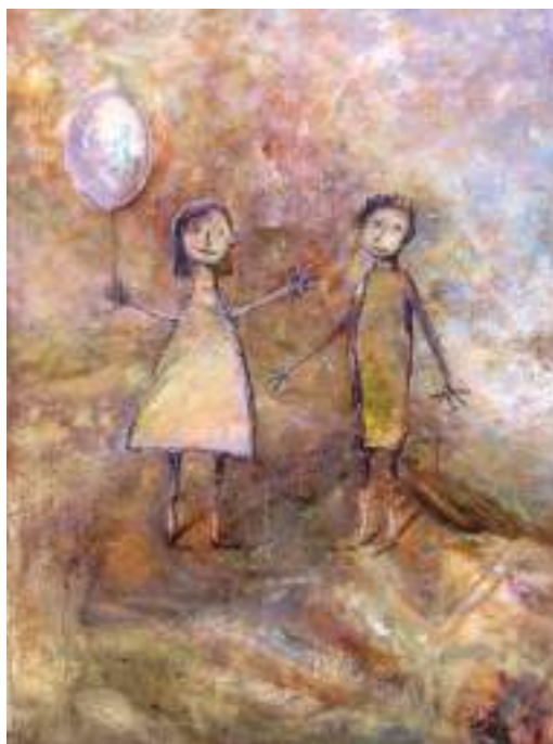
„Šventė“, 80x60, drobė, aliejus