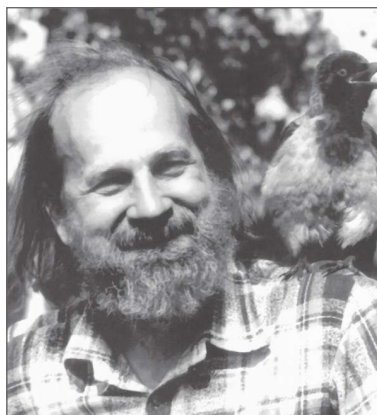
Pirmasis M. L. Rėzos kultūros ir meno premijos laureatas