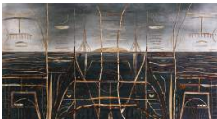
„Leidžiantis mėnuliui“, 110x60, 2003