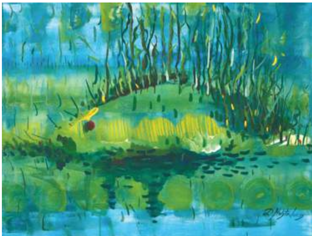
„Kur išplaukia vaikystės žuvis?“, 60x80, drobė, akrilas, mišri technika

Pati sukūrė iliustracijas savo eilėraščių knygoms. Tarptautinio poetų ir dailininkų plenero „Žodžiai ir spalvos“ (Lietuva, Lenkija, Baltarusija) dalyvė.