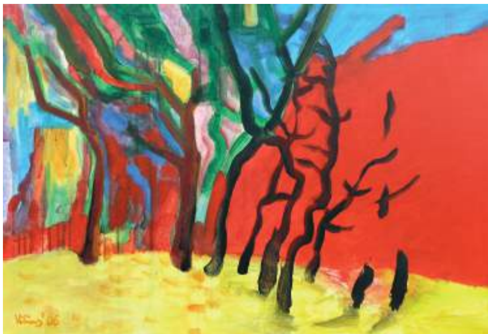
„Gaisras“, 2006 m., drobė, akrilas