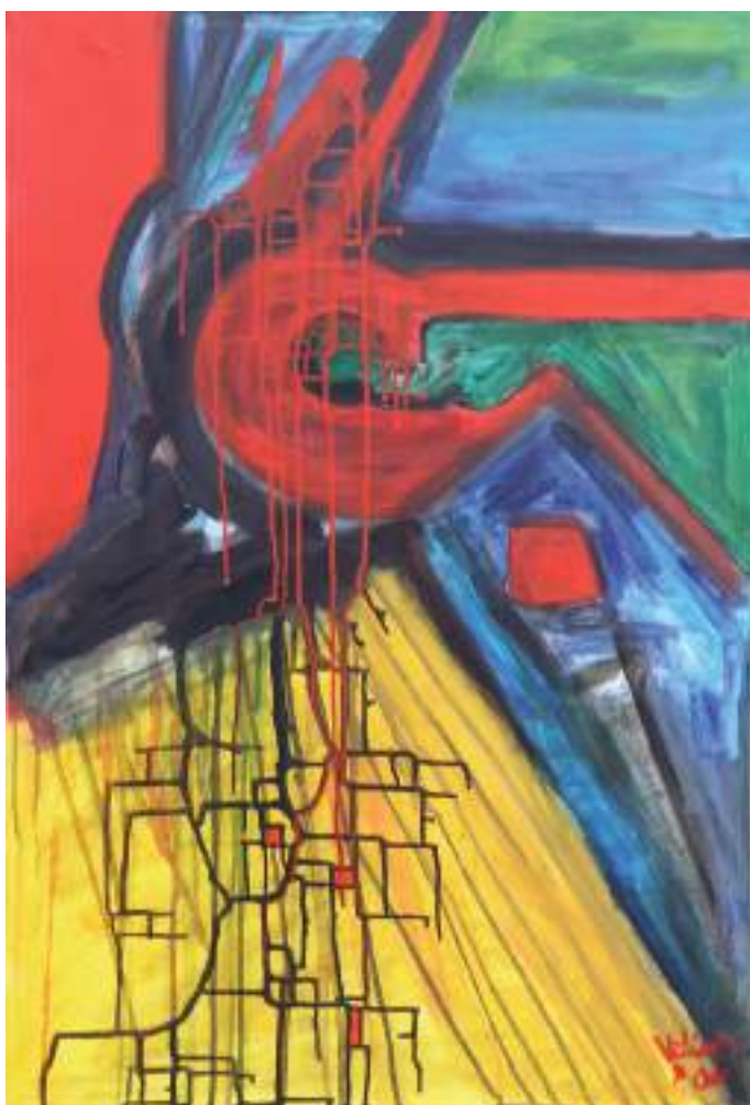
„Gaisras“, 2006 m., drobė, akrilas

2005 m. dalyvavo projekte „Pajūriais pamariais“, 2006 m. – plenero-projekte „Išgirsti, išklausyti ir suprasti gamtą gali menas“.