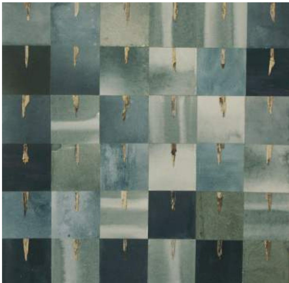
„Mėlynos dienos“, 65x65, 2004

Parodose dalyvauja nuo 1987 m. Nuo 1994 m. su šeima gyvena ir kuria Neringoje.