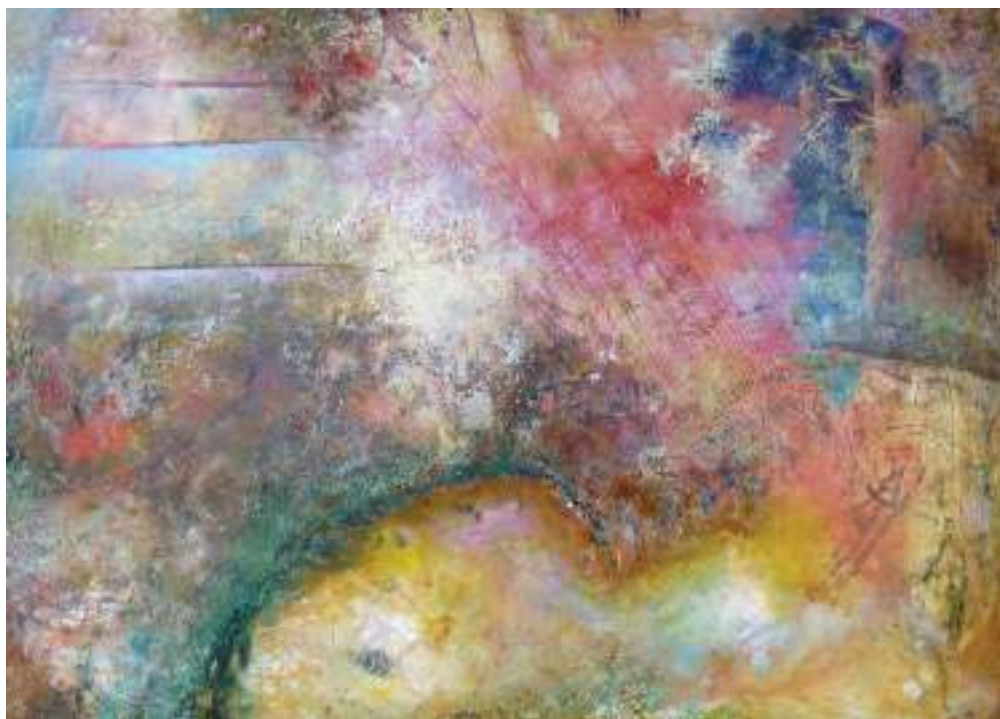
„Horizontalai“, 150x170, drobė, aliejus